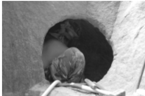
Tam uvnitř je Tets (vysekává dutou část kompozice).

Účastnila se řady mezinárodních symposií po celém světě, zejména však v románském jazykovém prostoru. Beatriz patří mezi zakládající členy skupiny Banda Ancha (Broadband), kterou tvoří čtyři sochařky, spolupracující na nejrůznějších