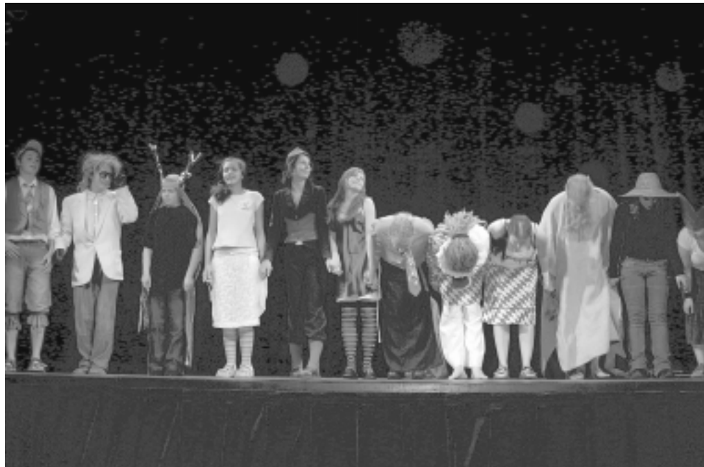
Italská komedie na scéně hořického divadla na radnici.