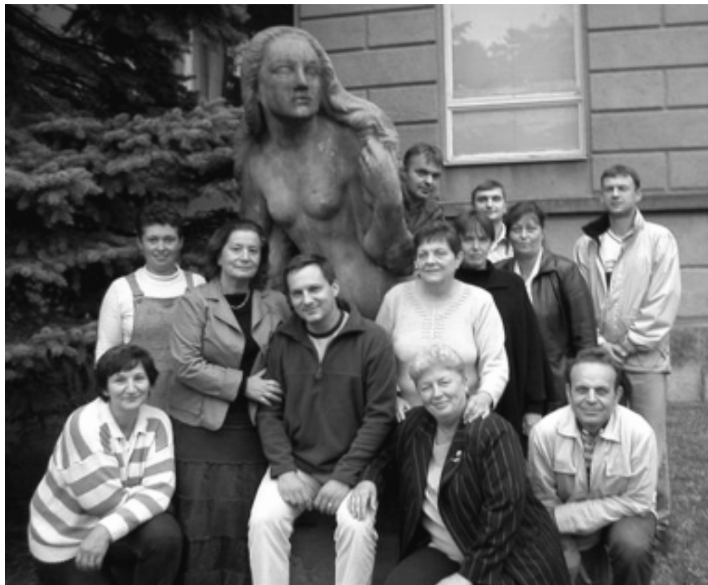
Kandidáti Šance mají rádi Probuzení. Ani zde se však jedenadvacitky nedopočítáte.

Prioritou je rozvoj města, chceme pro naše město a pro život v něm prosazovat prospěšné a rozvíjející nápady, chceme město pro život.