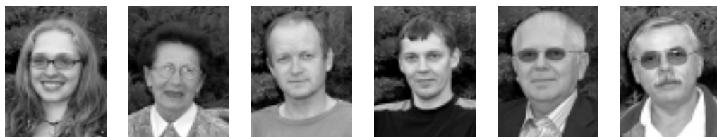
Kandidáti Šance, kteří šanci ke společnému fotografování propasli, se vyfotili zvlášť.