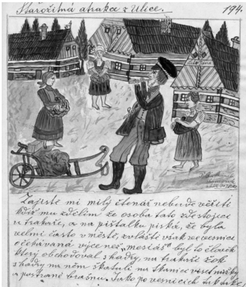
Obrázek potulného hadráře je z Safránkovy kroniky. Výstava kronik potrvá do konce října.