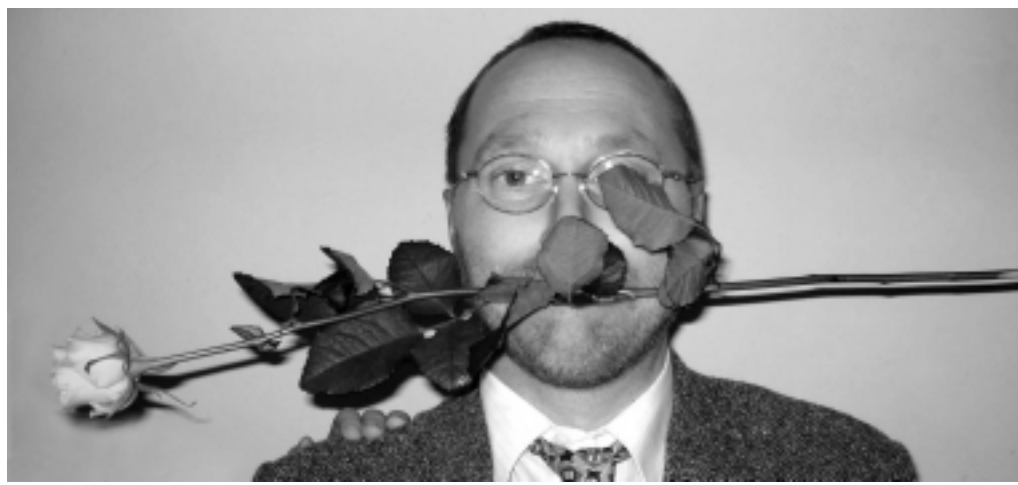
Taneční hodiny pro starší a nepokročilé pokračují minulou sobotu až k výuce tance tango. Povinnou rekvizitou pro pány byla růže v zubech. Povinnost dodrželi úplně všichni.