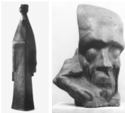
Zívrový plastiky ve sbírce hořické galerie: Řekyně (vlevo) a Hlava s rukou (vpravo).

V neděli 10. července se Zívra chystá na další týden pobytu v Hořicích: „Chystám vše pro zítřejší odjezd do Hořic. Boty - vařič - cukr - aparát atd. k lepšímu vybavení dle zkušeností prvního týdne, který je vždy nejtěžším začátkem. Zmínjuje také první názvy svých prací na sympoziu, které ale během tvorby změní: „Preclík a Schoenholtz se přiklánějí, že ze skic jsem nejvíce já v Oblázku a Článku . Rozhodl jsem se pracovat na Článku . Co se týče personálního obsazení symposia jsou stále potíže. Sochařka Šapošniková z Varšavy odmítla účast v Ružbachách 6 a odjíždí tam tedy sochař [Zdeněk] Palcr. Sochař Šimek odjel do Itálie a poslal kresebné schéma jak otesat kámen - pohodlně! Sochař Lenassi z Jugoslávie píše, odjíždí do Prahy, bez udání dne příjezdu do Hořic...“