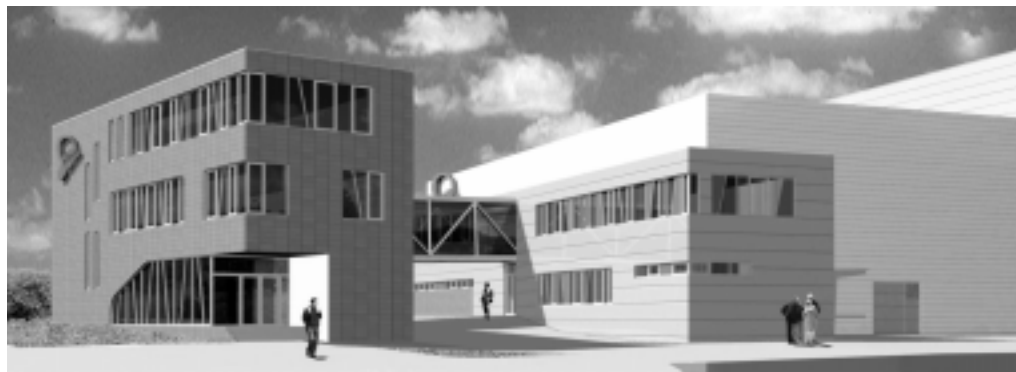
Vizualizace objektů společnosti Swell v hořické komerční zóně.

Prostory pro konstrukční kanceláře a další zázemí společnosti Swell začnou vyrůstat letos na jaře poblíž obchvatu a s jejich otevřením se počítá začátkem příštího roku. „Firma Swell hodlá během sedmi let do nového Centra vývojových služeb investovat přes čtvrt miliardy korun,” vyplývá ze zprávy, kterou dnes zveřejnila vládní agentura CzechInvest.