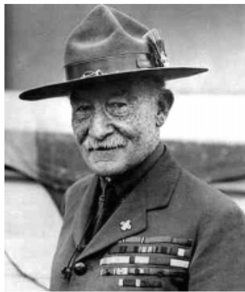
Baden-Powell si oblíbil kanadský jezdecký model klobouku Johna B. Stetsona a ten se ujal i mezi českými skauty.