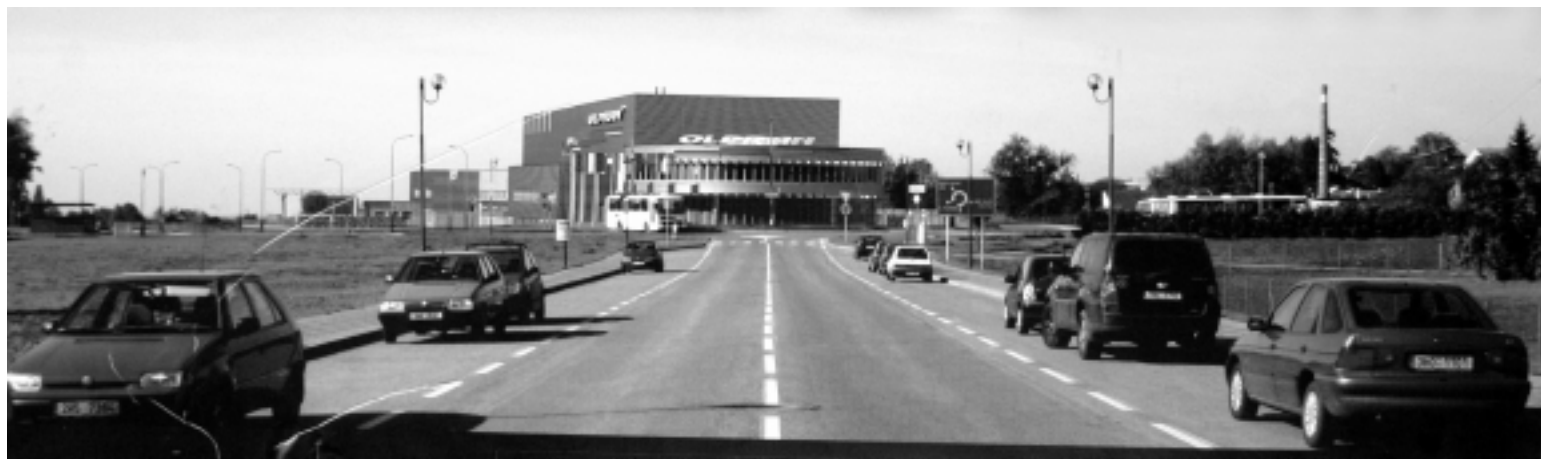
Vizualizace firemního objektu společnosti Olpran. Stavba je disponována při kruhovém objezdu, na ose ulice Aloise Hlavatého, a takhle se bude jevit z Hlavatého ulice při pohledu ven z města. Vpravo od ní bude diskontní obchod Plus, který už se staví a má být v květnu hotov. Nároží vlevo (mezi Hlavatého a Pelikánovou) zaujme nová budova pošty a dále při výjezdu (za Olpranem) má vyrůst provozní budova společnosti Swell.