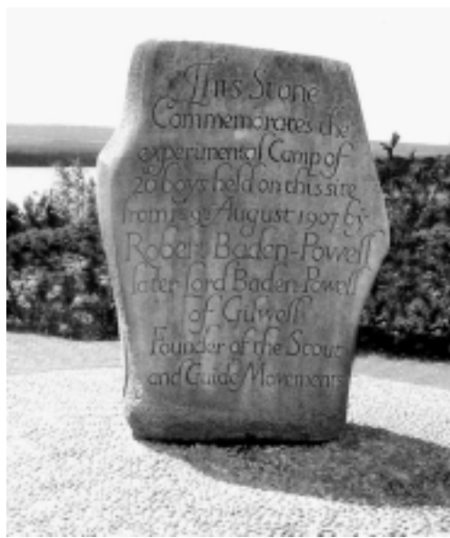
Kámen, který připomíná první skautský tábor na ostrově Brownsee v srpnu 1907. 30 000 skautů tam bude letos slavít 100. výročí.