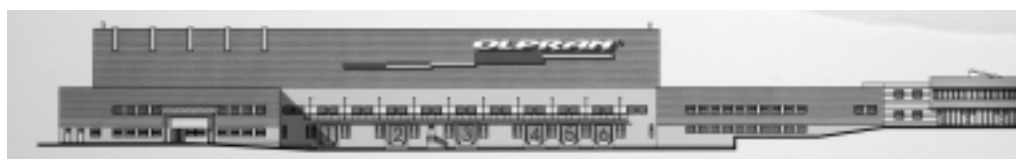
Pohled na montážní halu a další provozy společnosti Olpran od jihu. Dole situace nového centra při kruhové křižovatce a letecký pohled na objekty Olpran.